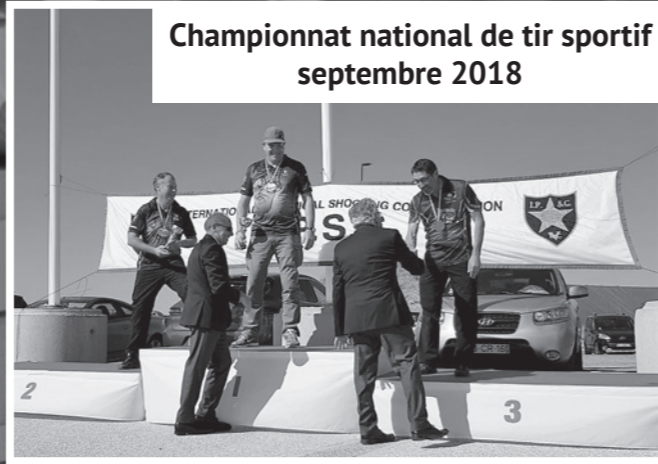
Championnat national de tir sportif septembre 2018