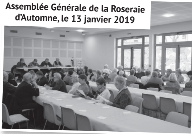
Assemblée Générale de la Roseraie d'Automne, le 13 janvier 2019