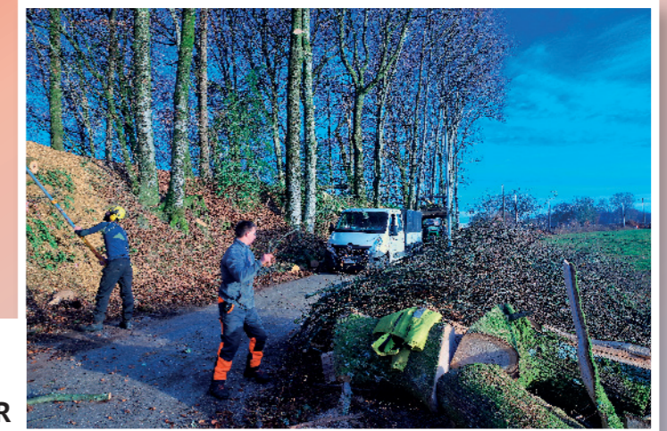
Elagage d'arbres dangereux sur la route de Trémouille, réalisé par l'équipe professionnelle d'élagueurs de l'ARCADOUR