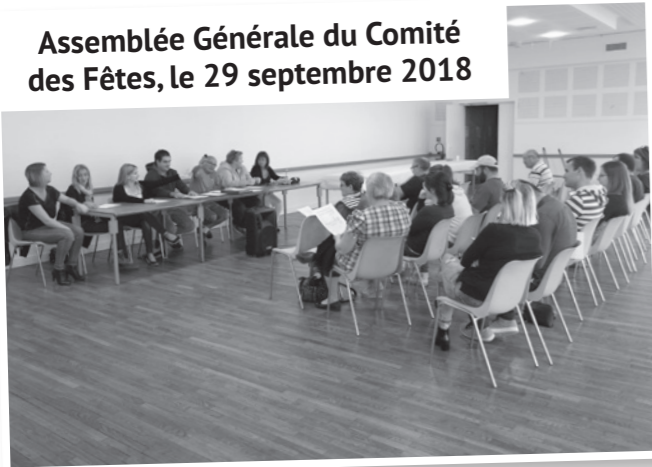
Assemblée Générale du Comité des Fêtes, le 29 septembre 2018