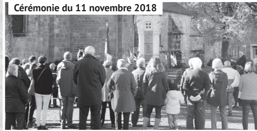
Cérémonie du 11 novembre 2018