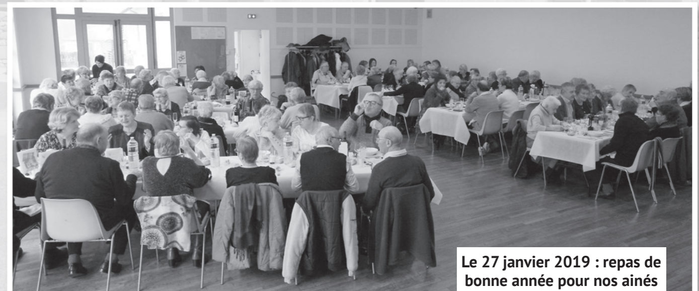
Le 27 janvier 2019 : repas de bonne année pour nos aînés

Il est rappelé que les comptes-rendus des conseils municipaux sont consultables sur le site internet de la commune : http://www.rosiers-egletons.com