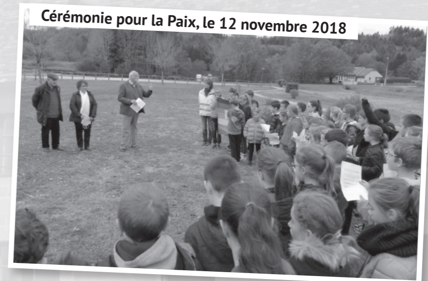
Cérémonie pour la Paix, le 12 novembre 2018