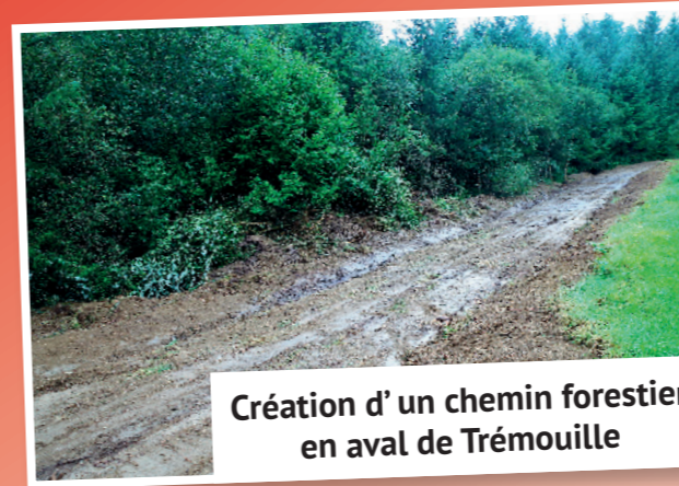
Création d'un chemin forestier en aval de Trémouille