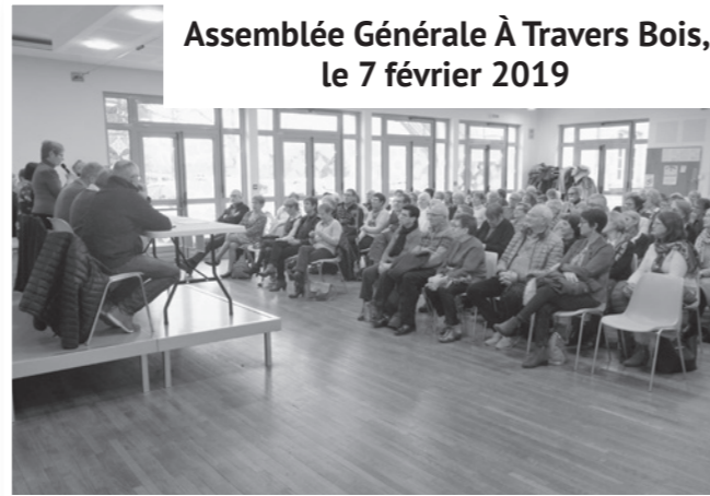
Assemblée Générale À Travers Bois, le 7 février 2019