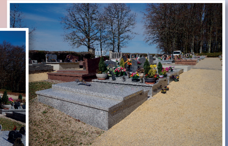
Finition des allées au nouveau cimetière par nos services techniques